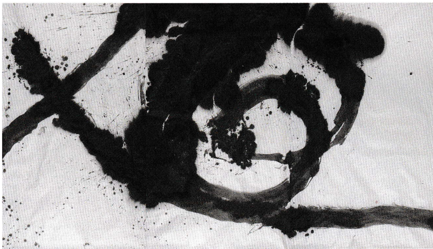
《廻》2023 紙・墨 240×432cm

〒951-8068新潟県新潟市中央区上大川前通10番町1864 Tel.025-222-6888