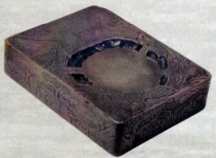
▲ 洮河緑石・蘭亭硯