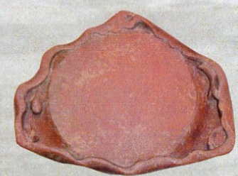
▲ 紅絲石・旭日大硯