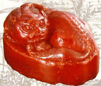
▲ 琥珀印材 (楊玉璇)