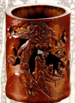
▲ 雕竹樹下五老図筆筒